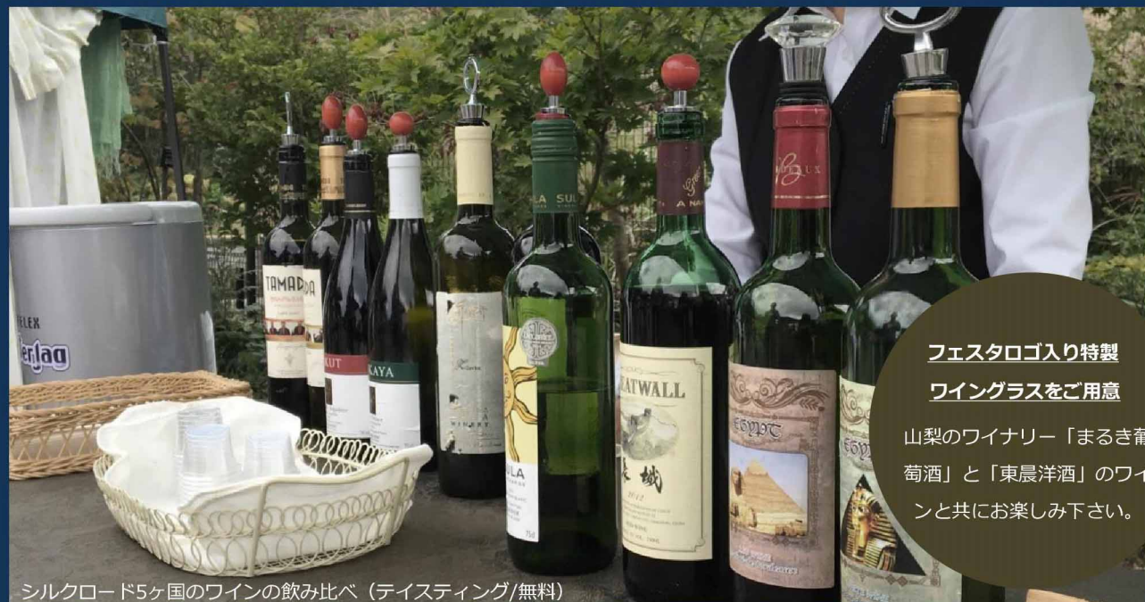
シルクロード5ヶ国のワインの飲み比べ (テイस्टィング/無料)