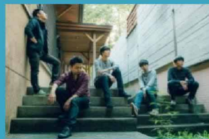
天候により中止になる場合もございます

山梨県出身のロックバンドが、今回アコースティックバージョンでLIVEを行います。激しくも優しい、人の心を映す彼らの音をお楽しみ下さい。